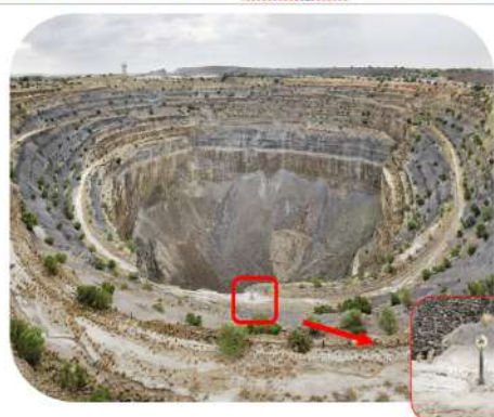
Koffiefontein Mine (south Africa) 7.6 million carats of diamonds = 1520kg = 0,4318 m 3