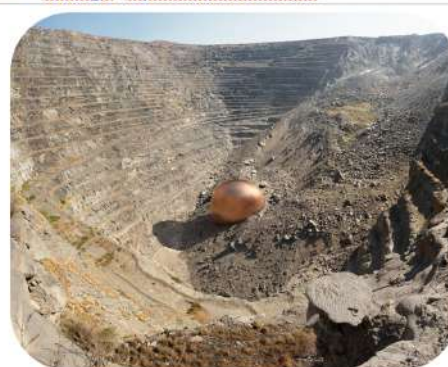
Palabora Mine (South Africa) - 4.1 million tonnes of copper = 458 612,97 m 3 = 122 piscines olympiques

Sur le climat : la fabrication d'un smartphone ou d'une télévision nécessite une grande quantité d'énergie (pour l'extraction des minerais, la transformation des matériaux ou le transport par exemple). Dans les pays où sont fabriqués nos équipements numériques, l'énergie utilisée est principalement d'origine fossile (pétrole, charbon, gaz). La production de cette énergie émet des gaz à effet de serre et ceci participe au changement climatique.