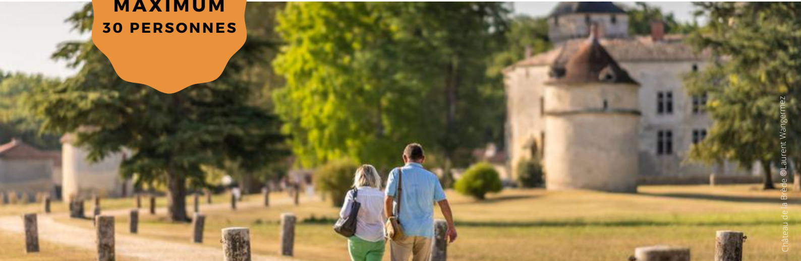
Château de la Brède

Rendez-vous pour une journée de découvertes sur le territoire de Montesquieu. Accolé à la métropole bordelaise, ce territoire doit son nom au philosophe, également baron de la Brède. Réputée pour son offre oenotouristique, vous avez encore beaucoup à découvrir "du nord du Sud-Gironde" !