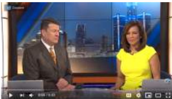
Microadventures vacation trend

https://www.youtube.com/watch?v=3yamQ72oflU