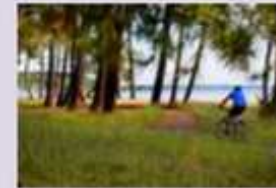
#BISCA pistes cyclables