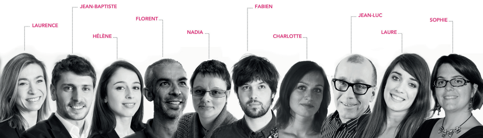
Equipe projet 2015