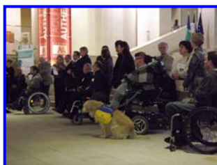
Le Collectif Handi Cap Aquitaine lors du Forum 2013

Handi Cap Aquitaine le collectif organisateur du Forum