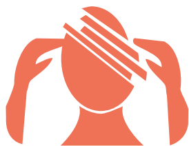
Déficiance psychique ou maladie mentale