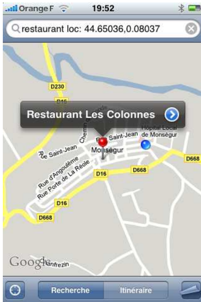
Localisation du restaurant