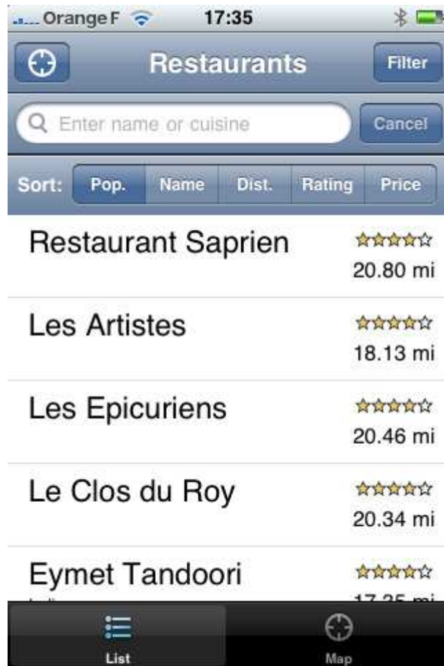
L'application du site d'avis