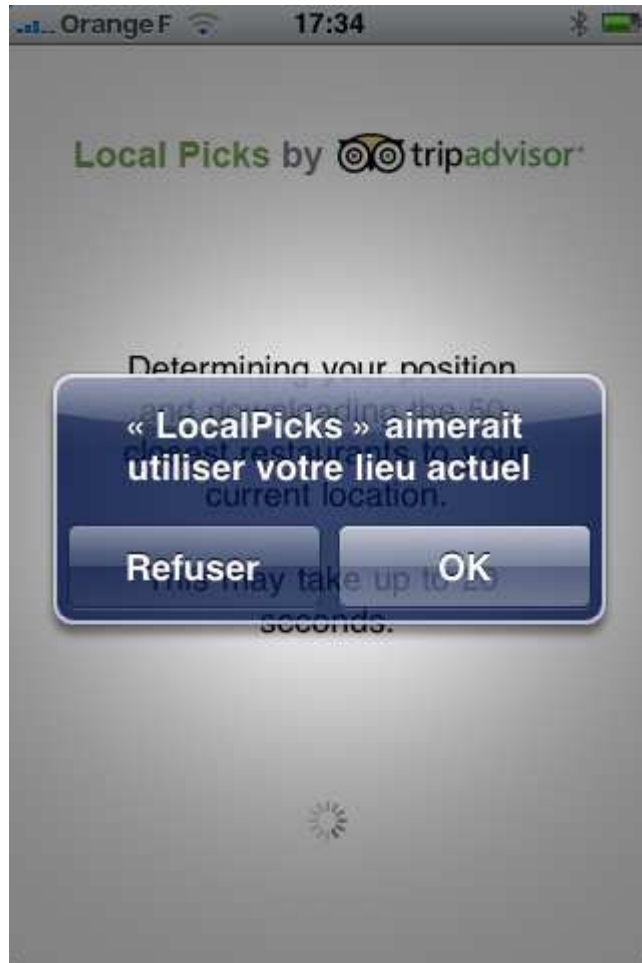
L'application du site d'avis