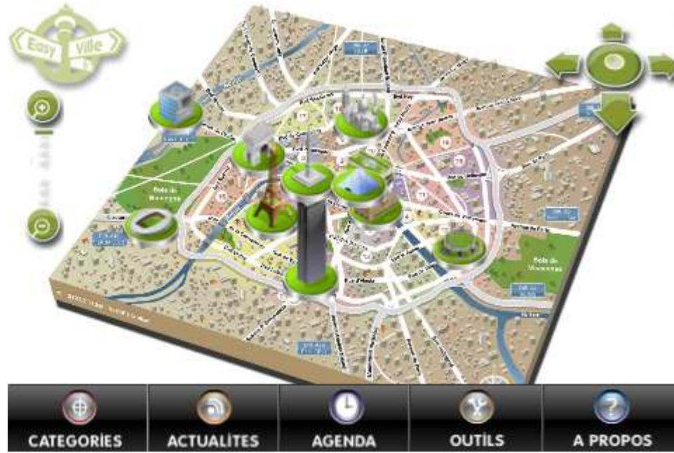
Plan en 3D